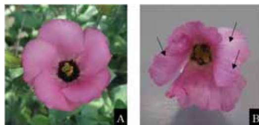
図 2 シンクロトロン光照射により得られたトルコギキョウ ‘メモリーピンク’ の M 1 世代における花色変異個体. (A) ‘メモリーピンク’. (B) 条斑が入る花色変異個体. →は条斑部位を示す.

合が多く、わい化など草丈に関する変異を示した個体は認められなかった。なお、葉についても、奇形などを含めて突然変異は認められなかった (データ未掲載)。