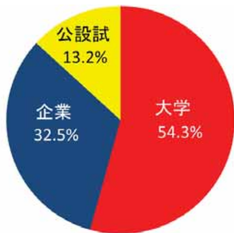
図 3 2020 年度産学官の利用割合（外部利用）

次に、表 3 に利用支援を行う利用区分を示す。利用区分は、「一般利用」、「公共等利用」、「トライアル利用」、「地域戦略利用」、「探索先導利用」、「先端創生利用」、「パイロット利用」の県指定管理費で行う利用を設定した。また、県内企業の課題解決を目的として「包括利用」を設定した。