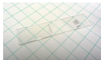
図1 Ag添加リン酸塩ガラスの写真

参照物質である1 \mu\text{m} 厚のAgホイル、BNと混合して作製した \text{Ag}_2\text{O} ペレットは、透過法での測定を実施した。一方、2種類のAgOは蛍光法で測定した。一方、測定試料である銀添加リン酸塩ガラスは、蛍光法にて測定を実施した。AgOは、カプトンテープ上に薄く粉末を塗ることによって試料を調製した。Ag添加リン酸塩ガラスは、株式会社千代田テクノルのガラスバッジに用いられているものを使用した（図1）。また、実験室で熔融急冷法によって作製した銀添加リン酸塩ガラスも、同様に蛍光法によって評価した。これらの試料は、He置換した試料チャンバー内にセットし、イオンチャンバーを用いて透過法を、単素子SSDを用いて蛍光スペクトルを測定した。また、スペクトルの解析には、Athenaを用いた。