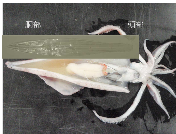
図1 ケンサキイカと軟甲