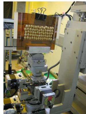
図2 照射時のダイズ種子