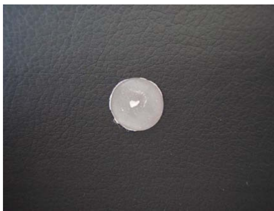
図1 平衡石のサンプル(直径1cmの樹脂に包埋された平衡石)

34個のサンプルに対して各1回シンクロトン光を照射してSr/Caを求め、各ケンサキイカの生体データと照合のうえSr/Caの傾向等を調べた。