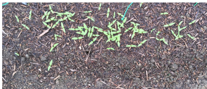
(図表 2 : 発芽の様子)