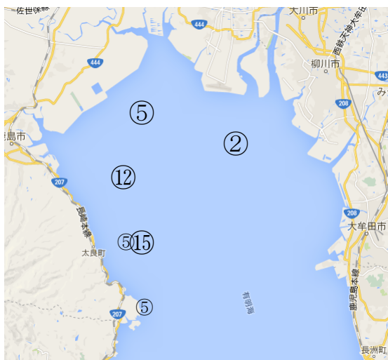
図 1. 採泥地点

実試料は、冷蔵庫で遮光保存していた、2012 年 8 月 23 日と 12 月 28 日、2013 年 2 月 12 日と 8 月 22 日、2014 年 8 月 27 日に有明海佐賀県海域でサンプリングした底泥である。図 1 に採泥地点を示した。今回の測定では 8 月の 3 年間分は 4 つの測定点全てを測定し、2012 年 12 月と 2013 年 2 月の底泥は採泥地点⑮のみ測定した。測定には湿ったままの底泥をグローブボックス中で窒素ガスを流しながらポリエチレン袋に詰めたものを使用した。クーラーボックスに入れて冷やしたまま九州シンクロトロン光研究センターに持って行き測定した。